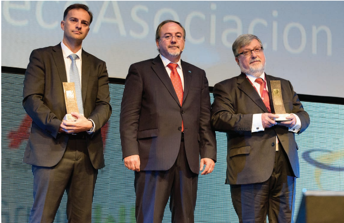
Los galardonados recibiendo los aplausos de los asistentes